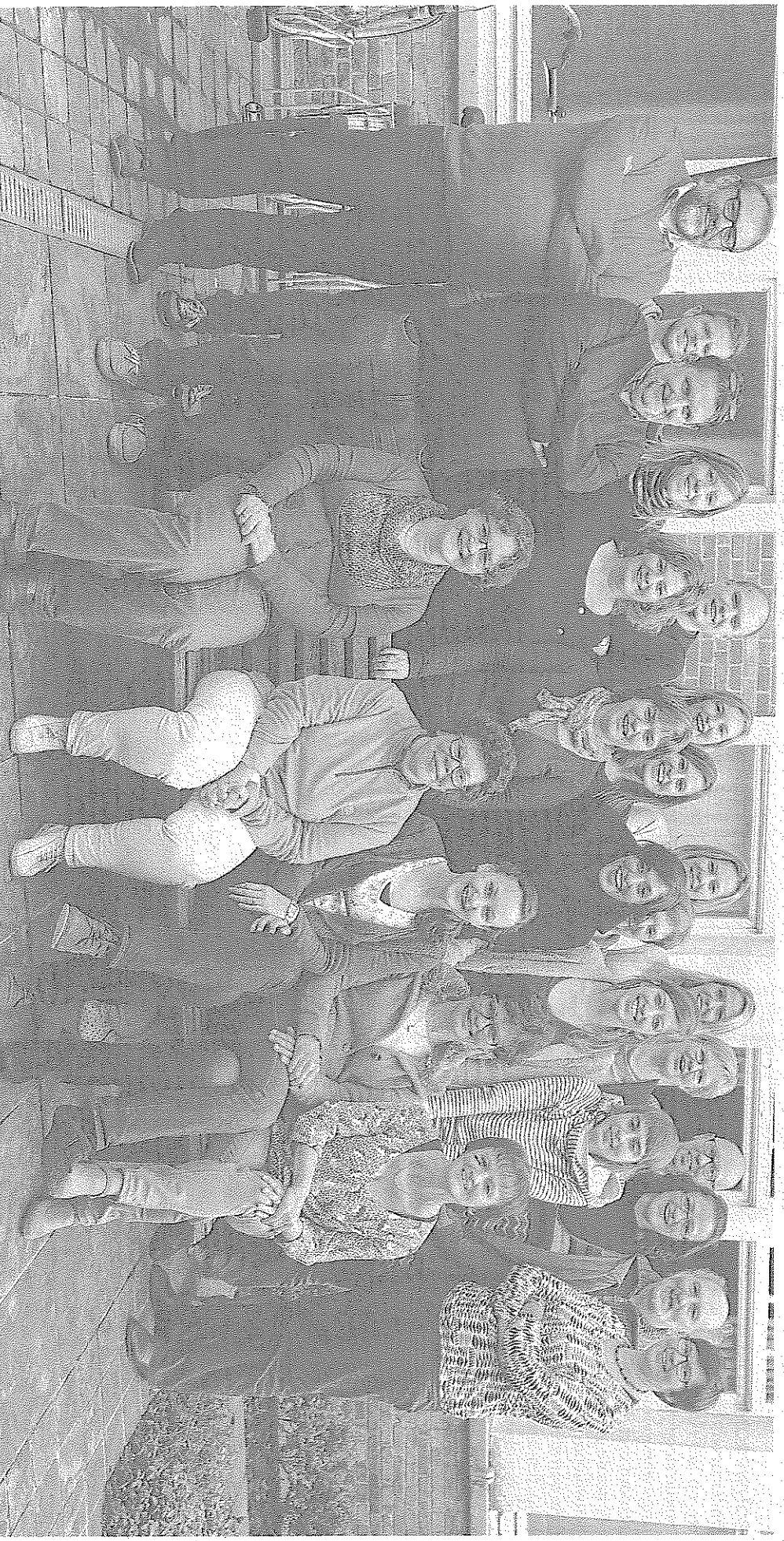
De personeelsleden van het CLB zitten volop in voor de kinderen en jongeren.