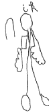
Kindtekening, J. 6 jaar